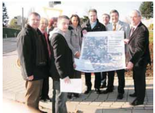
CDU-Kommunalpolitiker aus Karben, Bad Vilbel und Wöllstadt ziehen für die B3 an einem Strang.

Umso schneller müssen wir jetzt handeln. Die CDU setzt sich aktiv für die Nordumgehung und den B3-Weiterbau auf einer Trasse möglichst weit westlich um den Straßberg herum ein. SPD und Grüne sind beim Straßenbau zerstritten. Der SPD fällt daher nichts Besseres ein, als sich bei der Beschleunigung des B3-Weiterbaus der Stimme zu enthalten. Die Union dagegen hat eine klare Haltung. Sowohl der Bau von Umgehungsstraßen als auch der Ausbau der S-Bahnstrecke muss beschleunigt werden!